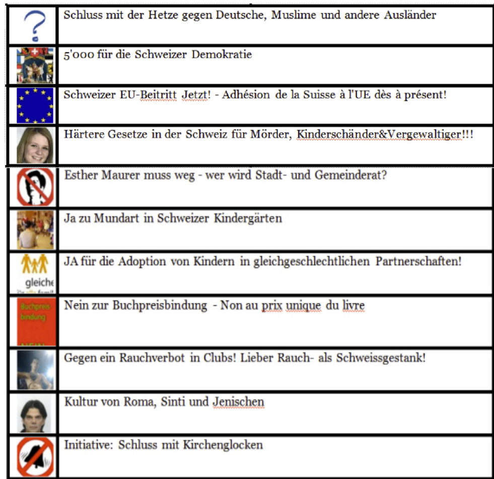
Abb. 2: Übersicht über die befragten Facebook-Gruppen.

Gründer wurden mit der Bitte angeschrieben, sich an der Umfrage zu beteiligen; ebenso wurde eine entsprechende Aufforderung an die Pinnwand der jeweiligen Gruppe geschrieben. Bei der Auswahl dieser Gruppen legten wir Wert darauf, ein breites politisches Interessenspektrum aufzugreifen – sowohl «linke» wie «rechte» Anliegen, aber auch solche, die politisch nicht so leicht zuzuordnen sind (Rauchverbot in Clubs, Buchpreisbindung, Schluss mit Kirchenglocken etc.). Dabei wurden Themen, die zum Zeitpunkt der Umfrage auf der offiziellen Agenda von Parteien standen und im öffentlichen politischen Diskurs verhandelt wurden (z. B. Migrationsfragen, EU-Beitritt, Mundart im Kindergarten etc.), ebenso berücksichtigt, wie «Lifestyle»-Themen, die in der offiziellen Politik wenig Resonanz hatten (Schluss mit Kirchenglocken oder gegen ein Rauchverbot in Clubs). Die Mitglieder folgender Gruppen erhielten die Aufforderung, einen Online-Fragebogen auszufüllen: