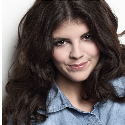
Abb. 1.: Nikki Yanofsky, Nikki Yanofsky © Steven Haberland ( http://static.universal-music.de/asset_new/237006/881/view/Nikki-Yanofsky---Steven-Haberland.jpg ).

Hieran erstaunt eigentlich... nichts . Mit diesem Beispiel – das auch ein ganz anderes hätte sein können – soll die Relevanz digitaler Medien für unsere Weltwahrnehmung unterstrichen werden. Dieses Beispiel überzeugt möglicherweise noch deutlicher, wenn ich verrate, dass Nikki aus Kanada stammt und in Montreal aufgewachsen ist – das ist just die Stadt, in der jährlich das weltweit grösste Jazz-Festival stattfindet: Um mit Jazz in Berührung zu kommen, hätte Nikki also auch einfach vor die Tür gehen können. So kann konstatiert werden: Digitale Medien beeinflussen in hohem Masse unsere Wahrnehmung und entsprechend die produktive Verarbeitung von Wirklichkeit.