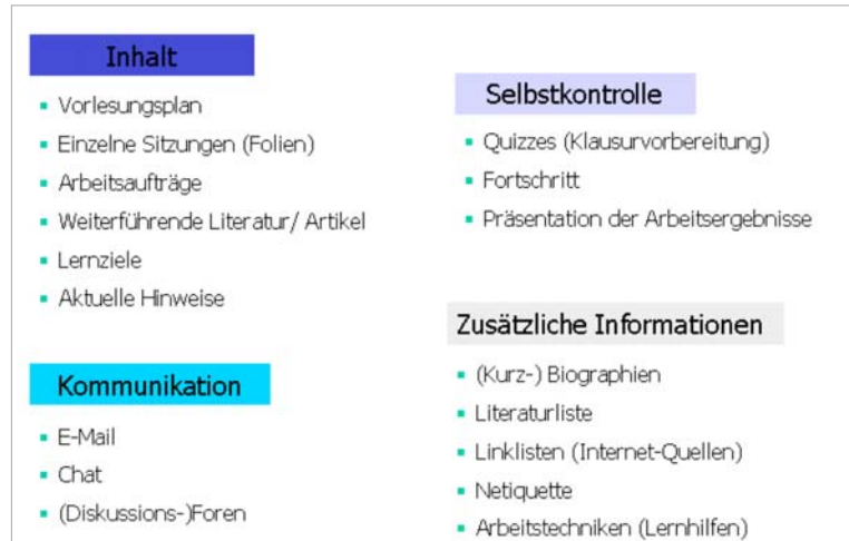
Abb. 1: Komponenten der Online-Lernumgebung

Die verschiedenen Komponenten der Online-Lernumgebung sind in Abb. 1 grafisch zusammengefasst.