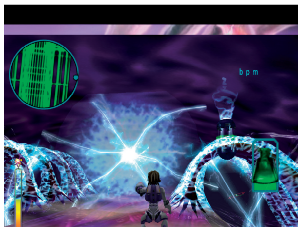
Abb. 2: Screenshot aus Re-Mission

Bislang wurden 100.000 Exemplare in drei Sprachen (Englisch, Spanisch und Französisch) in 78 Ländern verteilt. Darüber hinaus hat sich auf der Re-Mission -Website